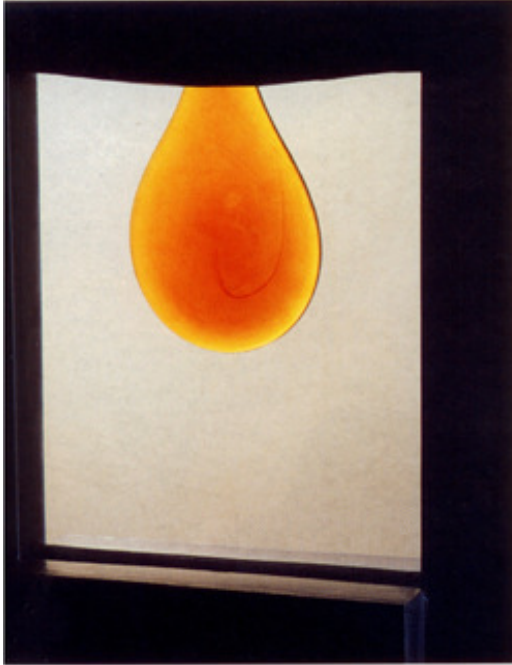
Damlanın hareketinin bir anına yoğunlaşarak tasarlanan heykel, hem 'o anı' ebedi kılmak hem de kırılganlığı korumak için kurşun bir çerçeveye çevrelenmiş.